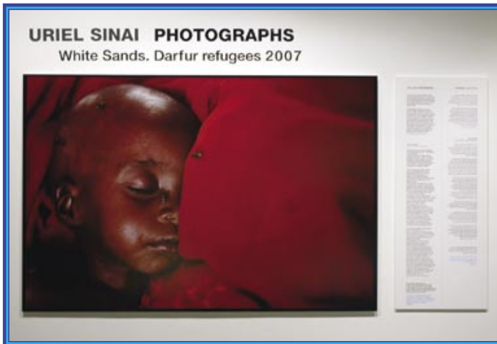
מתוך תערוכת הצילומים